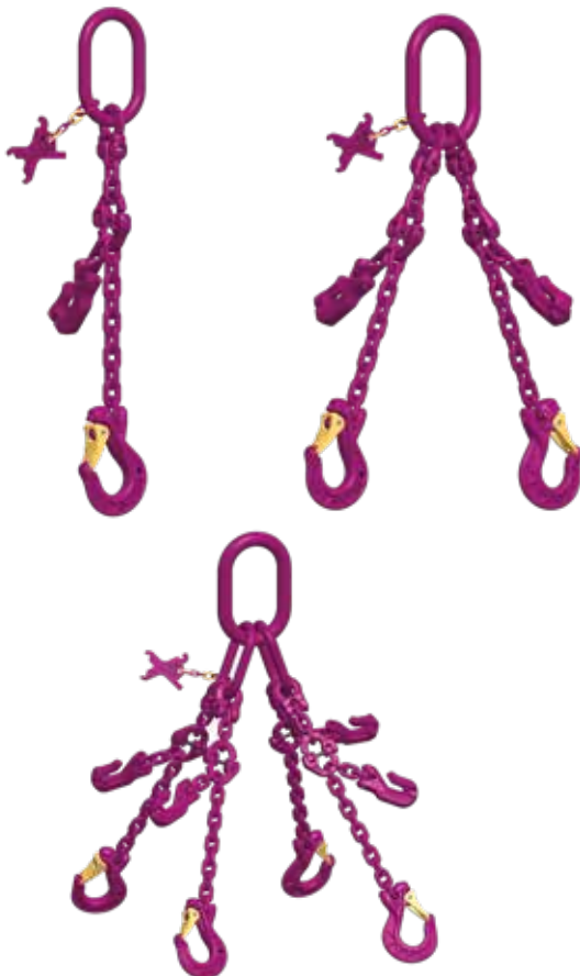
Abbildung: Verkürzungsklaue (statt Haken) gegen Mehrpreis!